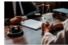
Defesa e Direitos Sociais