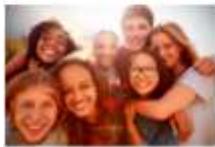
Infância e Adolescência