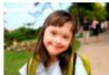
PRONON E PRONAS/PCD